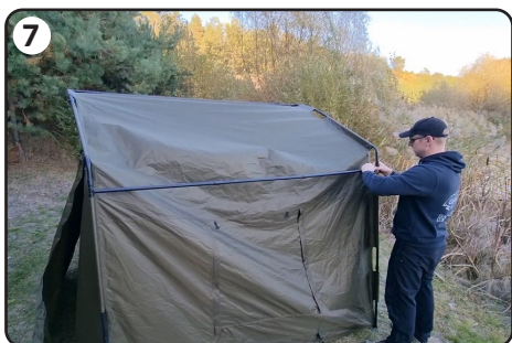
7 Napnij boczne ściany przy pomocy 2 dodatkowych rozpórek.