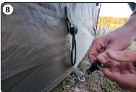
8 Przypnij namiot szpilkami do podłoża.