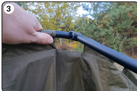
3 Zaczynj od środkowej rozpórki zamocowanej na górnej części namiotu.