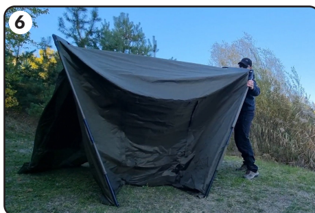
6 Postaw namiot.