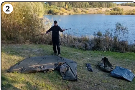
2 Rozłóż dodatkowe rozpórki.