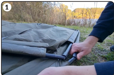
1 Połącz wszystkie pałaki stelaża namiotu.