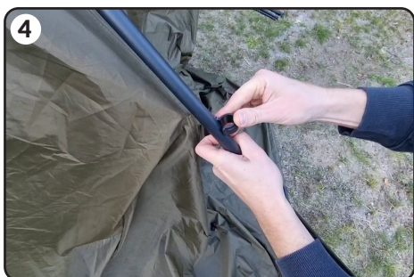
4 Dopnij materiał do rozpórki.